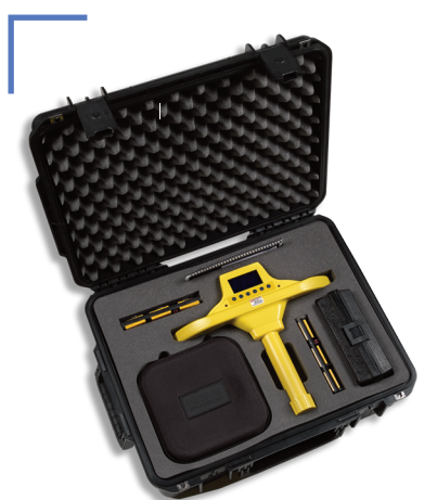
AML PRO et ses accessoires dans sa valise de transport