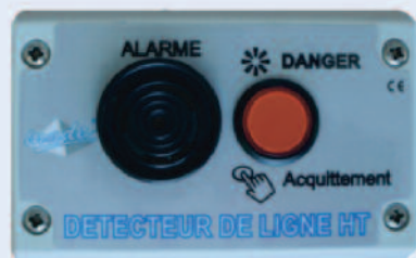
Boîtier de VISUALISATION EXTERIEUR