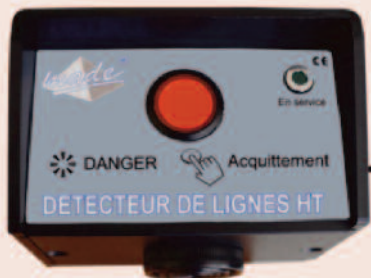
Boîtier de VISUALISATION CABINE : Placé sur le tableau de bord