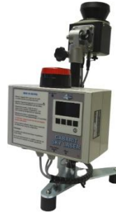
Orientation du LIDAR pour une surveillance horizontale