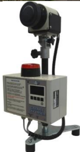
Orientation du LIDAR pour une surveillance verticale